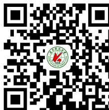
4.本科生在读证明(本科生预毕业证明)