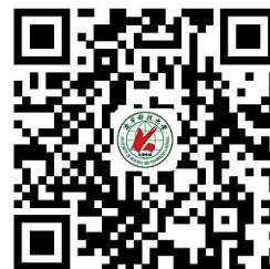
违规禁办事项清单