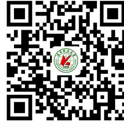
容缺办理事项清单