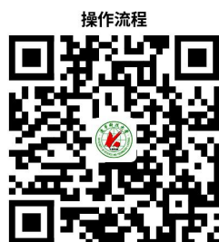
40.校外车辆入校申请